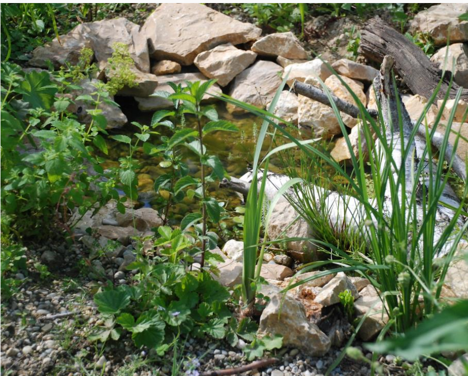
Zwei kleine Wasserstellen