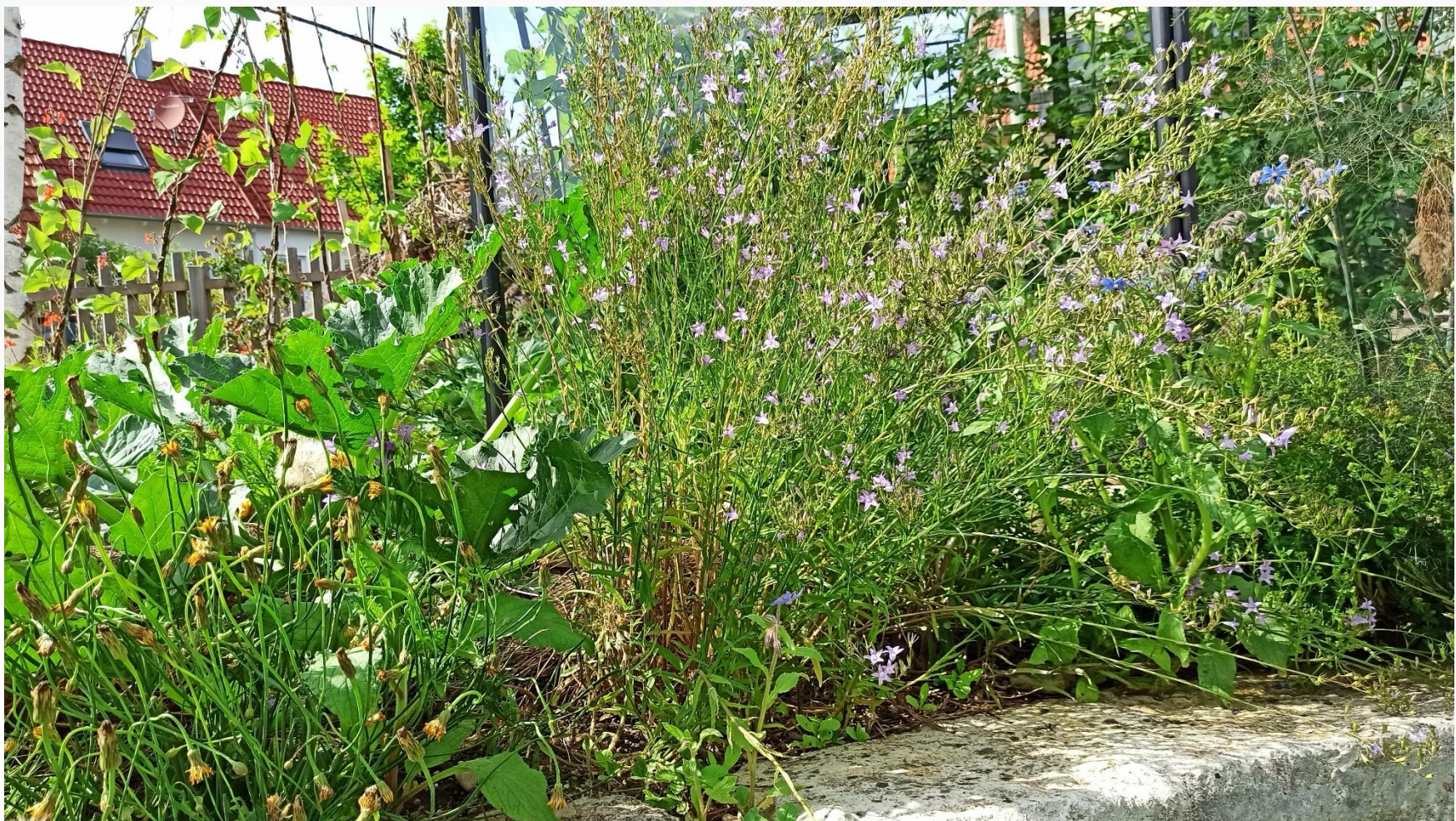
Rapunzelglockenblume und Borretsch am Rande des Gemüsebeets (Sabine Gerhardus)